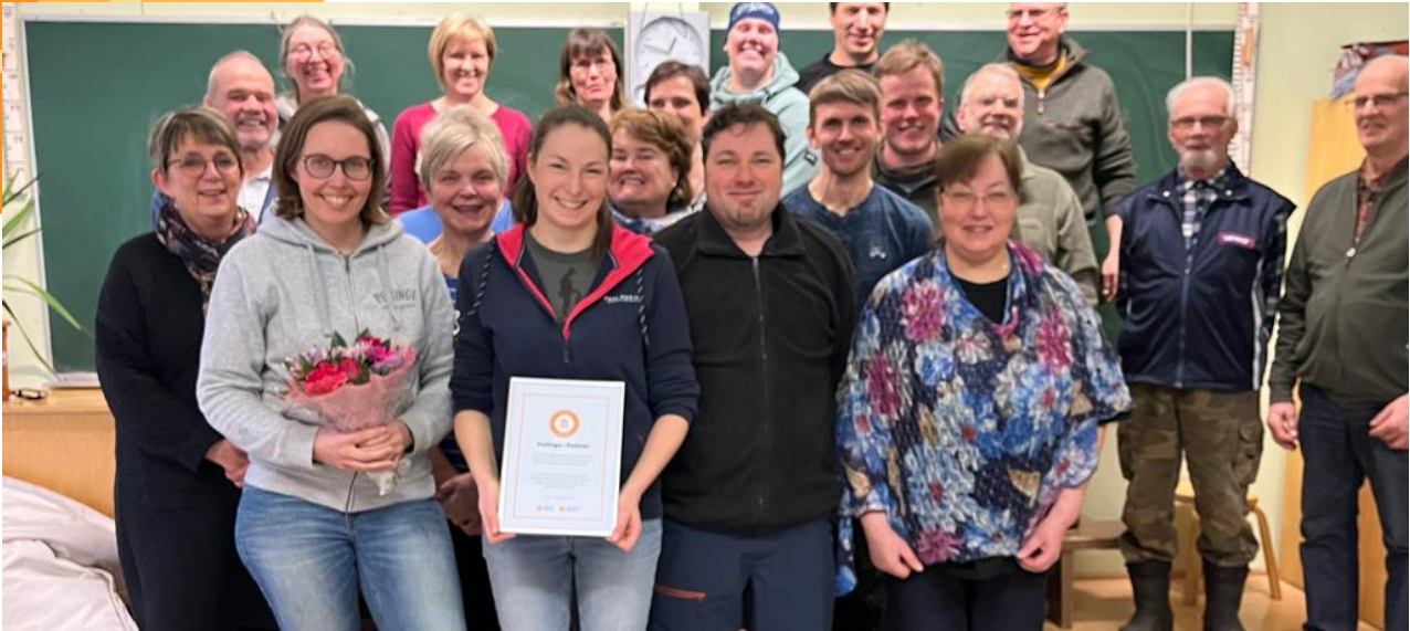
Kuvassa Pellingin asukkaita onnittelutilaisuudessa